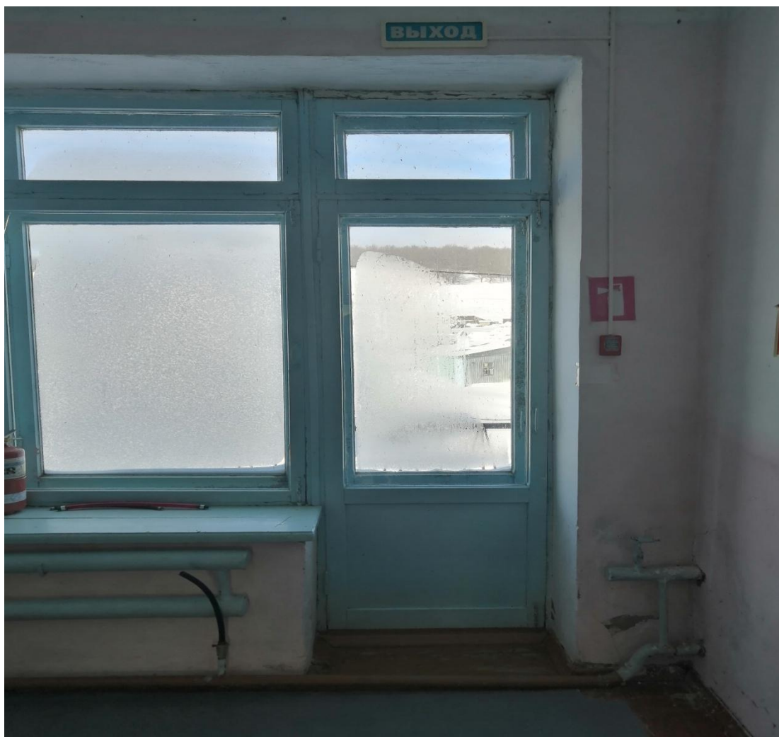
№11- Пути эвакуации