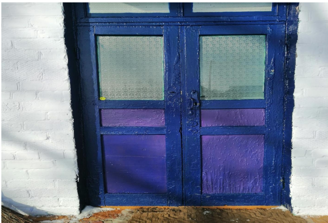
№6 – Дверь входная