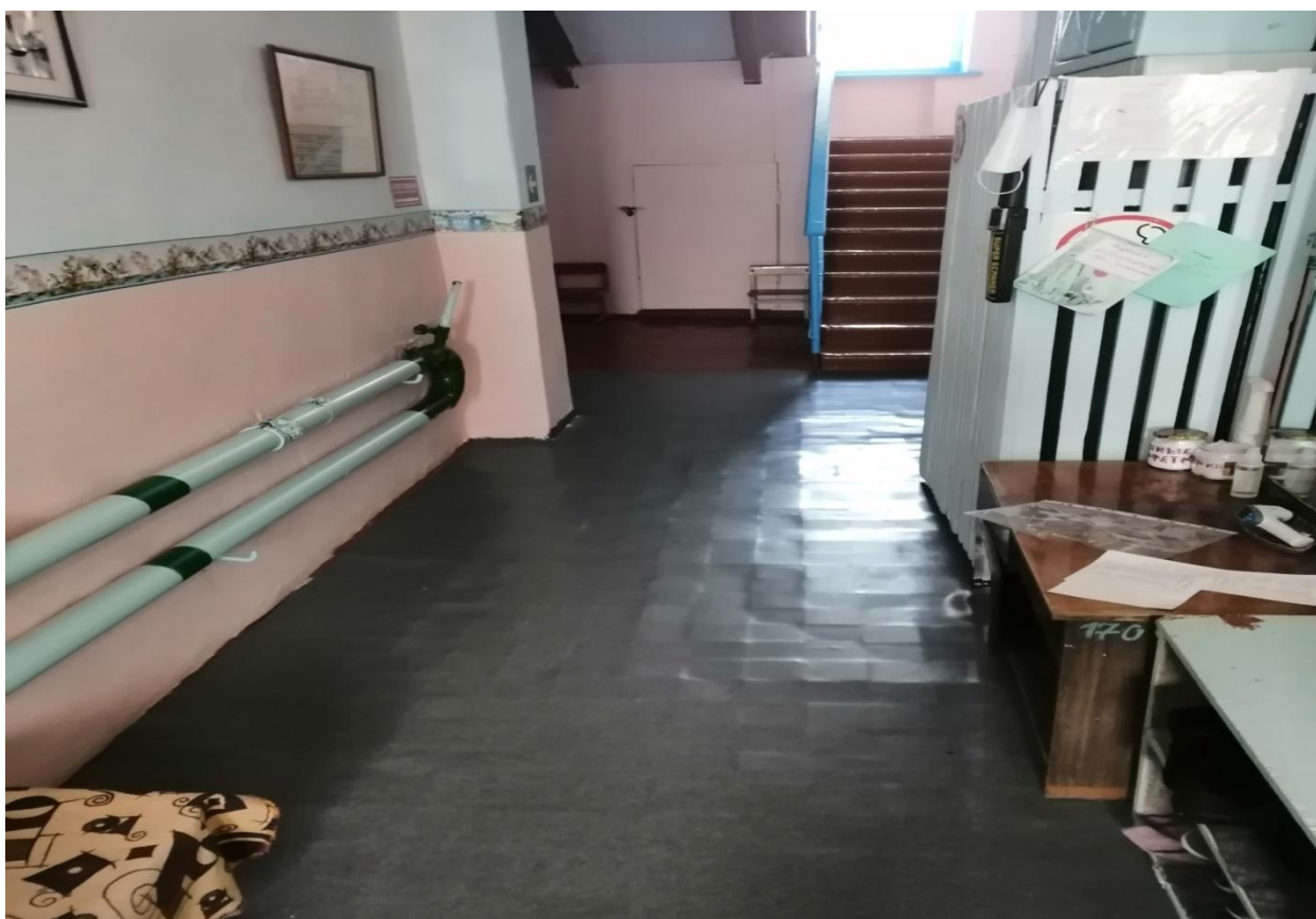
№8 - Коридор