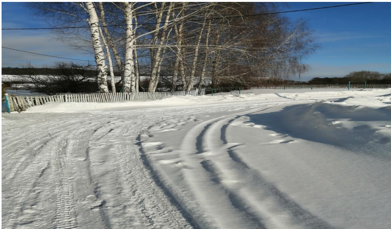
№3 – Автостоянка