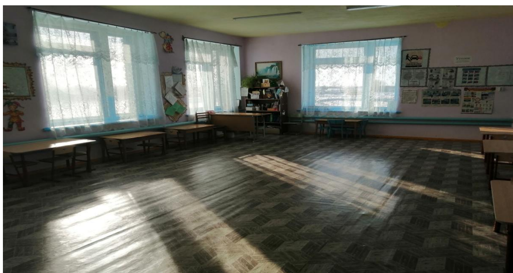
№12- Кабинетная форма