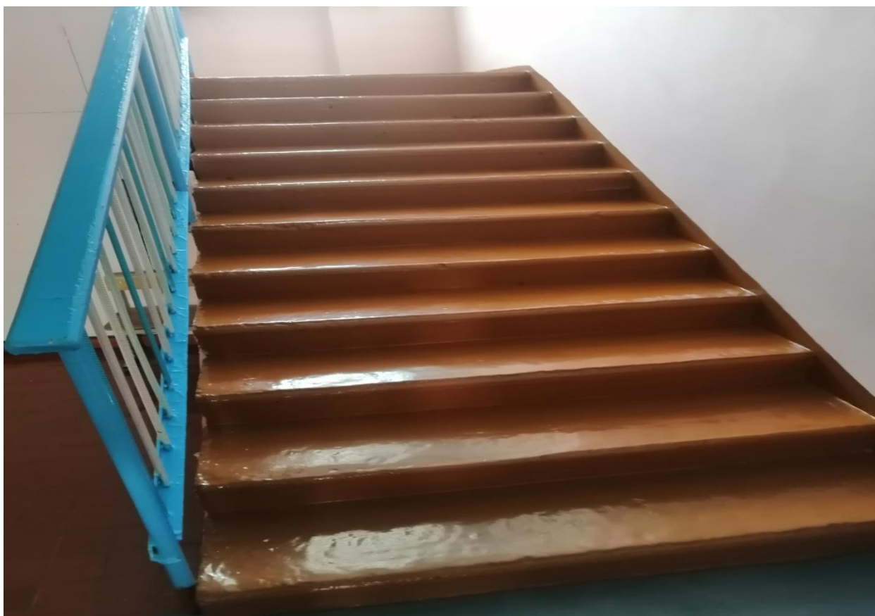
№9 – Лестница внутри здания