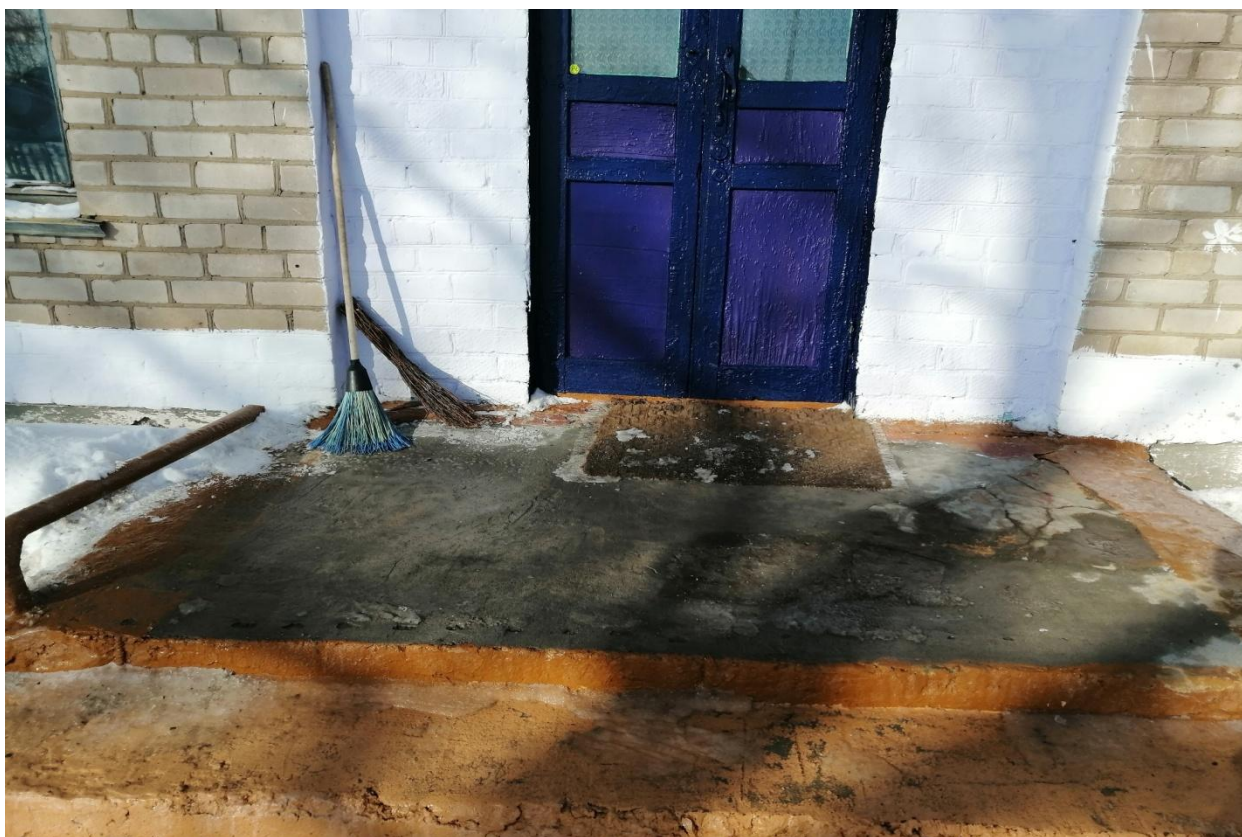
№5 – Входная площадка