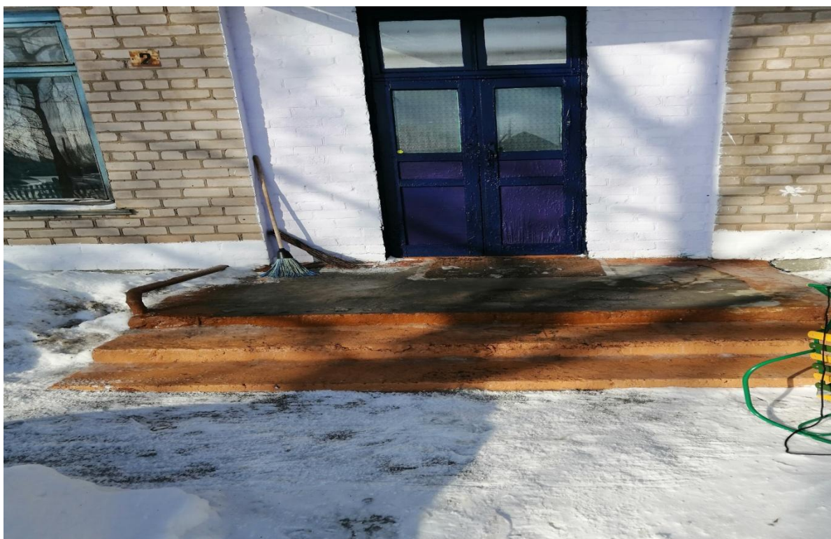
№4 – Лестница наружная