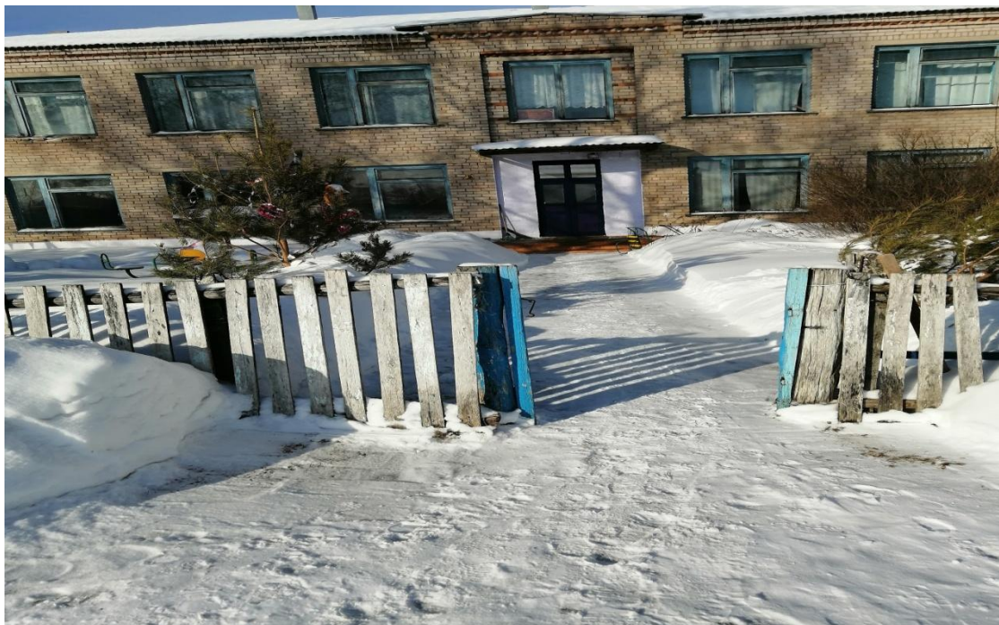
№1- Вход на территорию