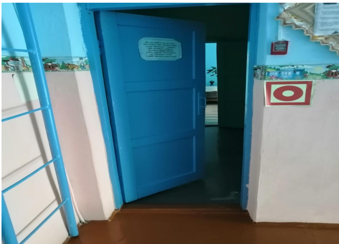
№10- Дверь внутри здания