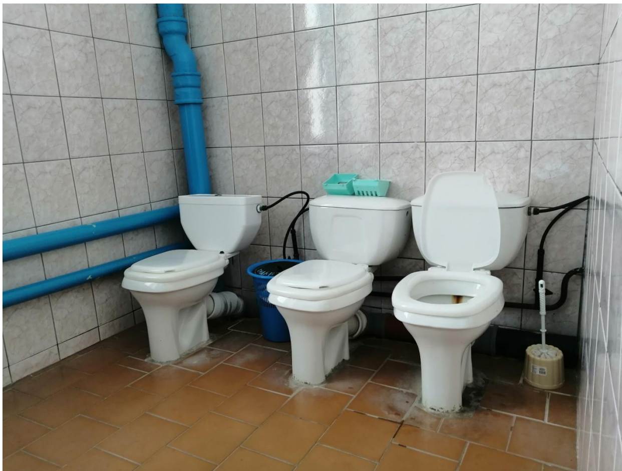
№13 – Туалетная комната