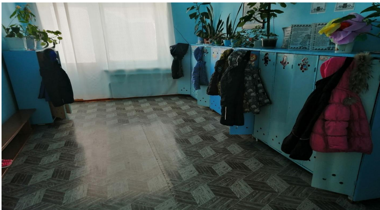
№14 - Гардеробная