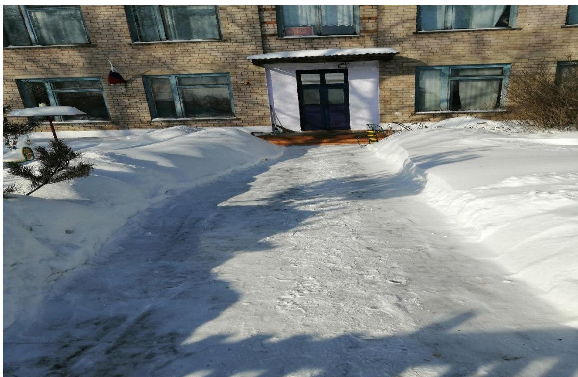
№2- Пути движения на территории