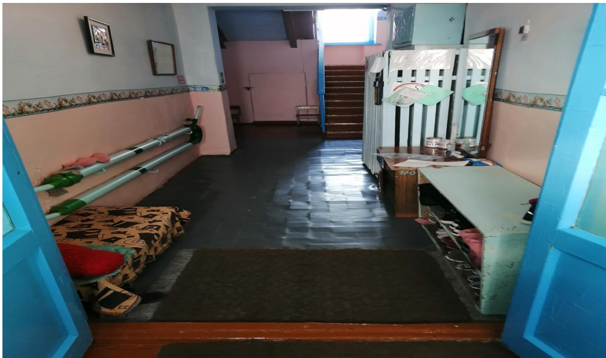
№7 – Тамбур